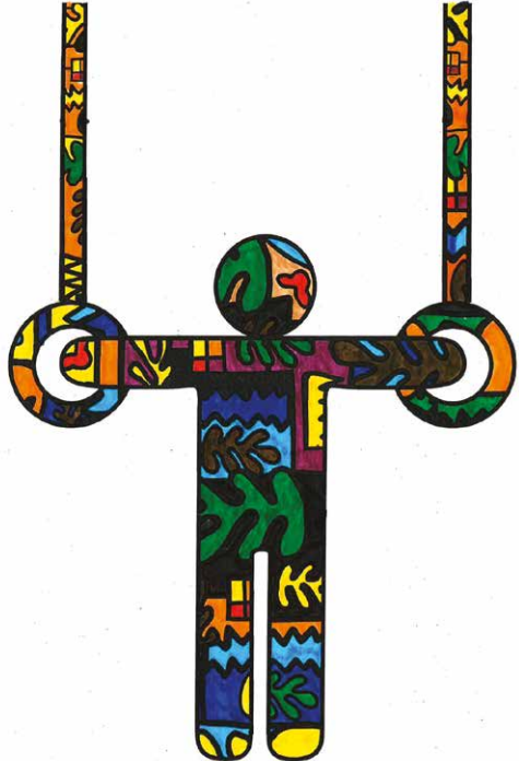
Carolina, 3P, Conches