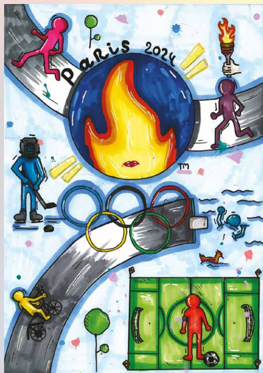
Tania, 8P, Gradelle