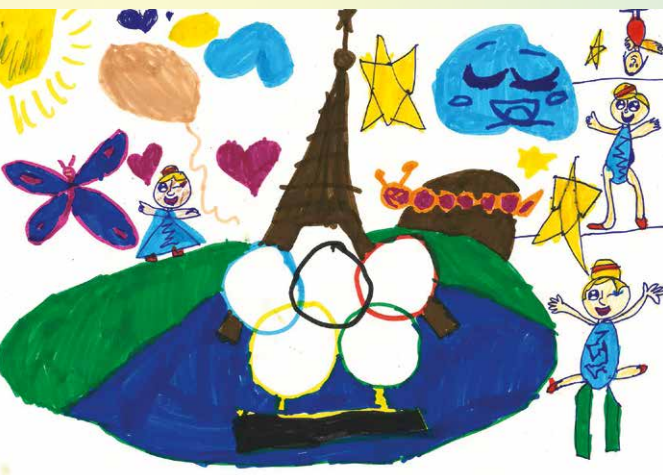
Amna, 2P, De-La-Montagne