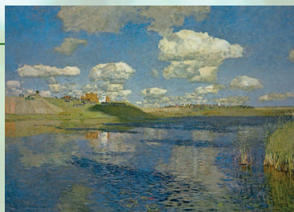
Paysage slave - Rous'

Sous la direction de Mathieu Malinine , diplômé de la HEM de Genève, héritier d'une lignée de musiciens transmettant cette tradition depuis plus de cinq générations, l'ensemble fait vivre un riche patrimoine vocal slave.